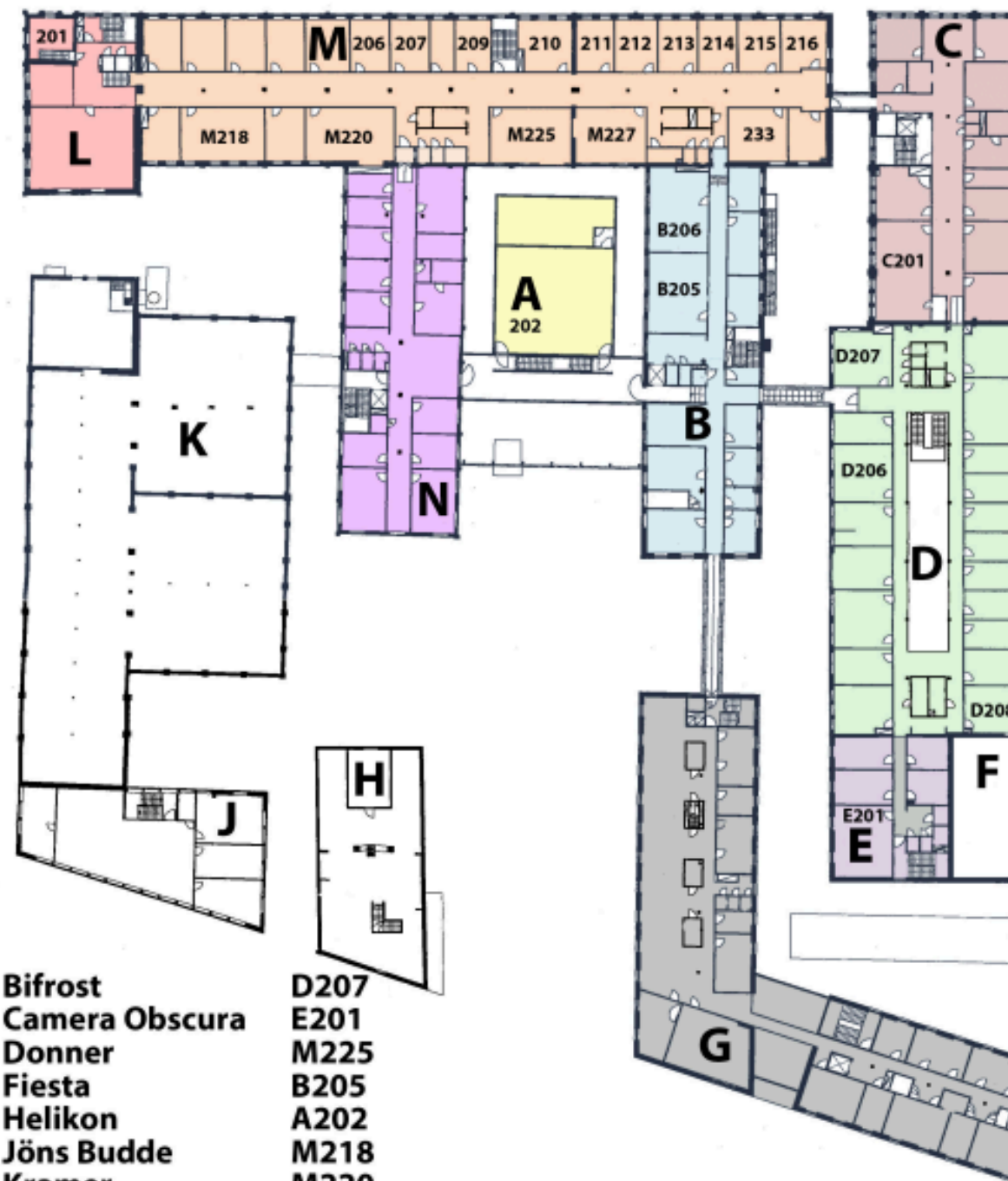
ARKEN VÅNING 2

Bifrost D207 Camera Obscura E201 Donner M225 Fiesta B205 Helikon A202 Jöns Budde M218 Kramer M220 Källan C201 Lorelei B206 Pantheon D208 Rolf Pippings torn L201 Smedjan M227 Valhall D206