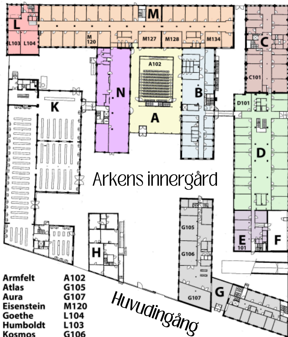
ARKEN VÅNING 1

Armfelt A102 Atlas G105 Aura G107 Eisenstein M120 Goethe L104 Humboldt L103 Kosmos G106 Nikander D101 Radiatorn E101 Saussure M128 Simone Weil M134 Westermarck C101 Voltaire M127